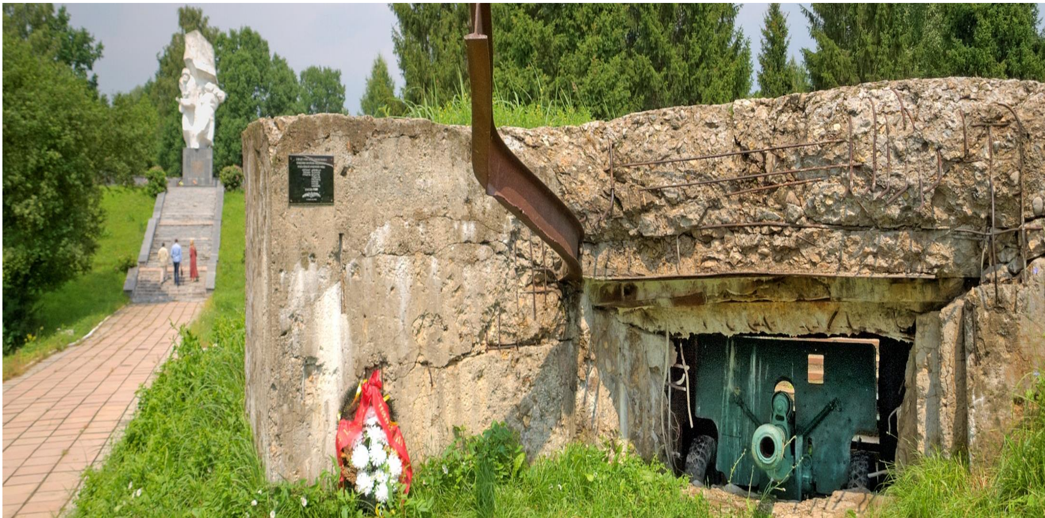
Калужская область «Огненная Варшавка»