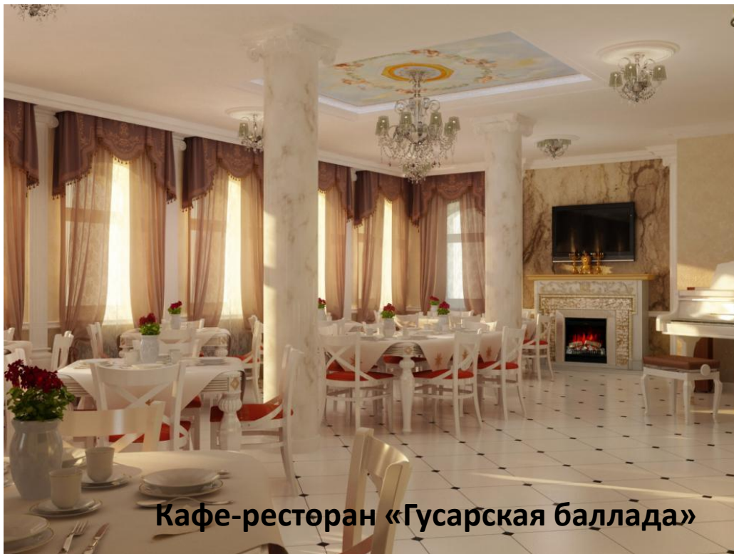
Кафе-ресторан «Гусарская баллада»