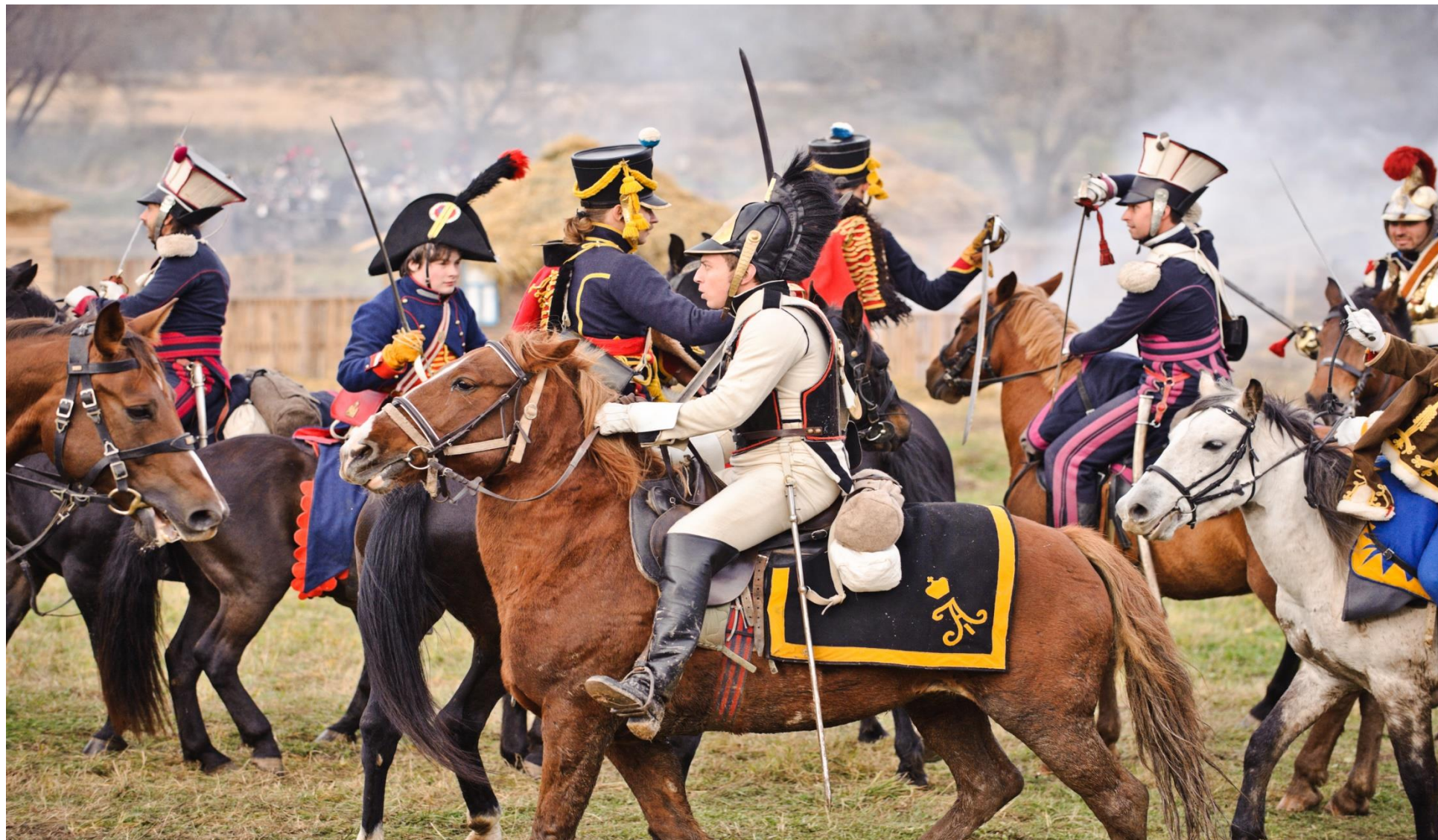
Калужская область «Кутузов vs Наполеон»