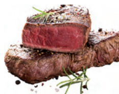
Говядина, телятина цесарка, кролик