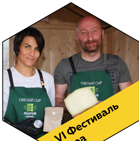
VI Фестиваль сыра