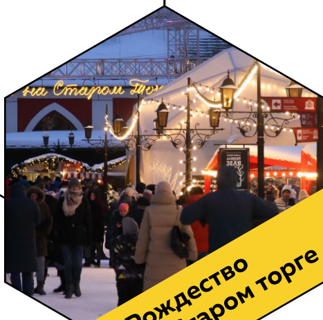
Рождество на Старом рынке