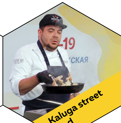
Kaluga street food